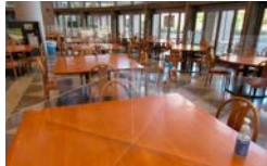
パーテーションの設置