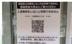
QRコードによる入室登録